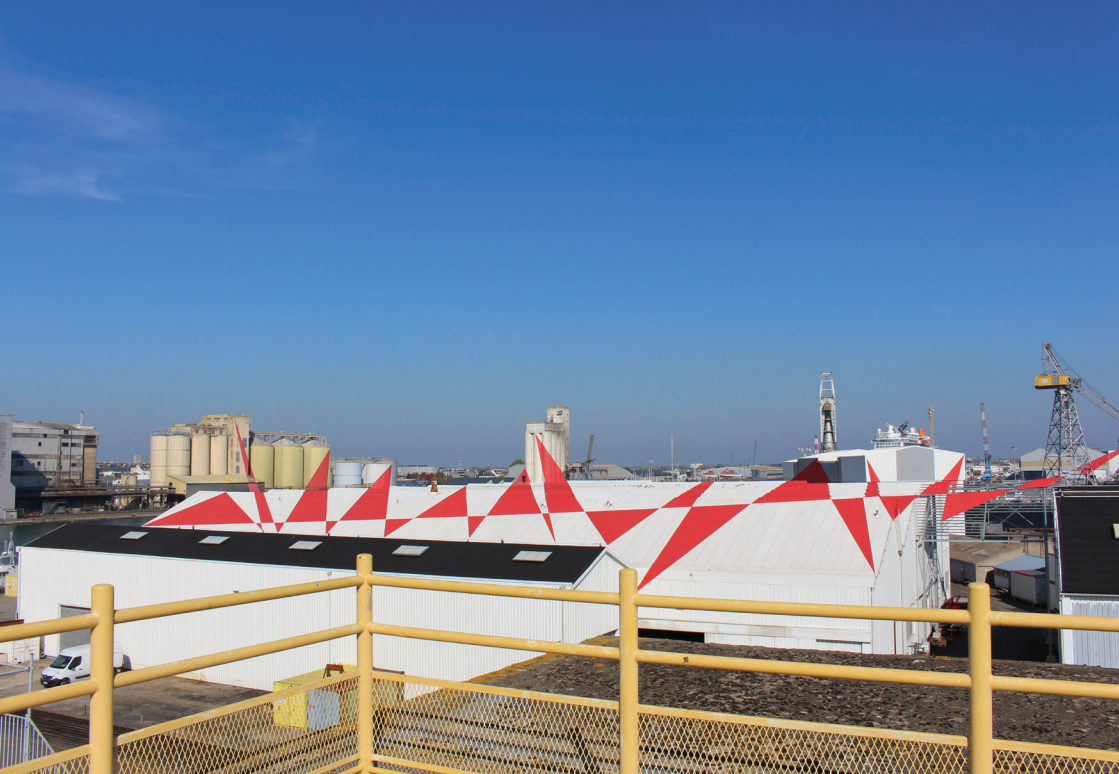
Felice Varini, Suite de triangles , 2007, Saint-Nazaire