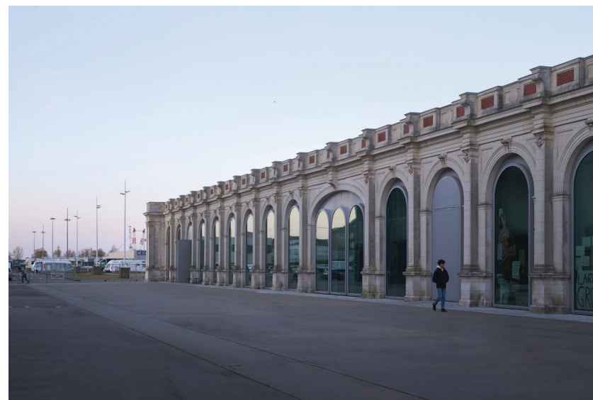
en haut : Vues d'ateliers des étudiants, Saint-Nazaire. en bas : Vue du nouveau site des Beaux-Arts Nantes Saint-Nazaire, Titan architecture, 2022.

Possibilité de bourses sur critères d'excellence.