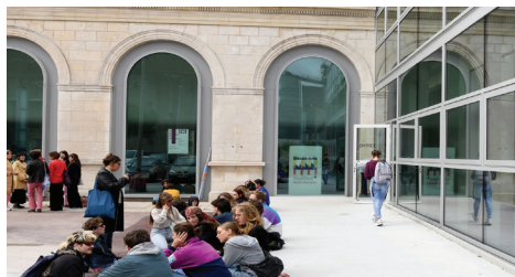
Site de Saint-Nazaire. Inauguration 15/11/2022 Architecture Titan, Nantes.