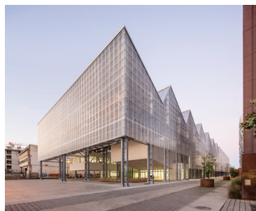
Site de Nantes. Ouvert depuis septembre 2017 Architecture Franklin Azzi, 2017.

Les Beaux-Arts Nantes Saint-Nazaire sont situés au cœur d'un territoire culturel et artistique exceptionnel avec de nombreux musées, galeries et centres d'art, et à seulement deux heures en train de Paris.