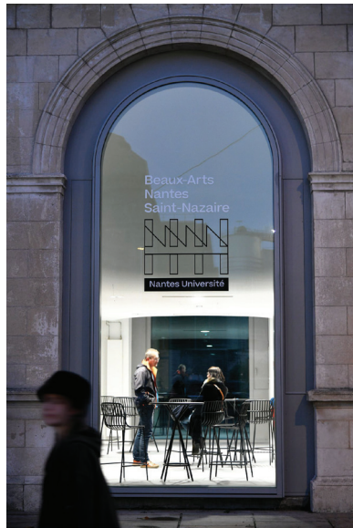
à gauche : Site de Saint-Nazaire. Architecture Titan, Nantes. Photo Martin Launay, Ville de Saint-Nazaire, 2022 ci-dessous : intérieur 1 er étage. Photo Mai Tran ci-dessous : Workshop sur la plage, Saint-Nazaire Photo Beaux-Arts Nantes Saint-Nazaire, 2020